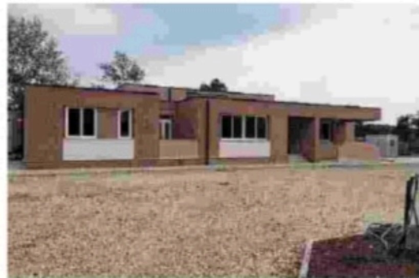
La nuova scuola dell'infanzia di Marina di Minturno

I lavori resi complicati nelle ultime ore per l'ondata di maltempo